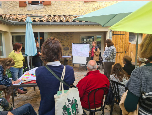
Photo prise lors des restitutions des ateliers

...un territoire qui permettrait aux populations exilées qui partent de chez eux, de pouvoir y rester avec dignité, c'est-à-dire de l'éducation, du travail, de la nourriture, un logement, etc".