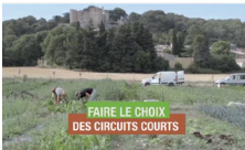
Vidéo «Faire le choix des circuits courts»