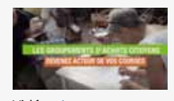
Vidéo «Les groupements d'achats citoyens : devenez acteur de vos courses»