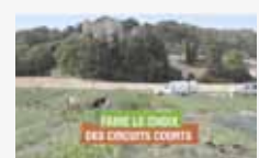
Vidéo «Faire le choix des circuits courts»