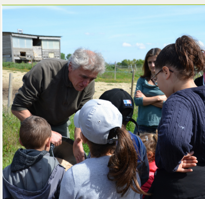
Visite de ferme