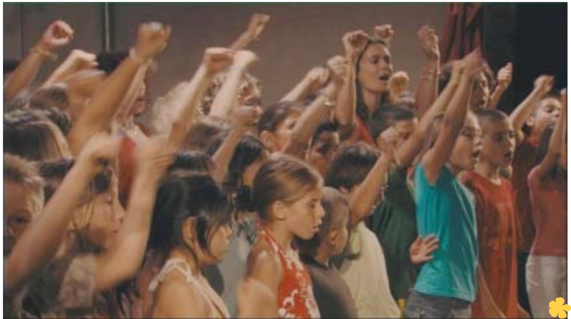
>Enfants école primaire de Barjac